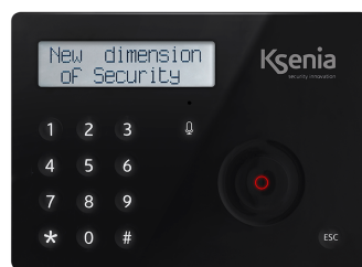
KS12100020.302 - ergo-S nera