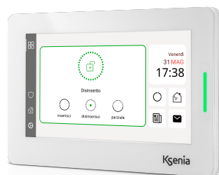
KS12100050.301 - bianco

Il touchscreen capacitivo offre una risposta al tocco precisa e immediata ed integra un'area RFID per la lettura delle chiavi di sicurezza RFID Ksenia. Un LED RGB per la segnalazione di stato, un buzzer e due morsetti configurabili come Ingresso (NC, NA o bilanciati) oppure come Uscita (OC 500 mA max) completano le funzionalità del dispositivo.