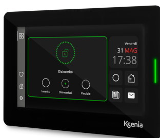
KS12100050.302 - nero

La tastiera creo-S offre una protezione avanzata contro tentativi di manomissione grazie alla protezione antistrappo per rilevare la rimozione non autorizzata del dispositivo, blocco temporaneo dell'accesso in caso di inserimento errato del PIN (max 3 tentativi).